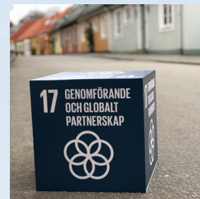
Utställning med lokala företag som visar hur de arbetar med de globala målen.